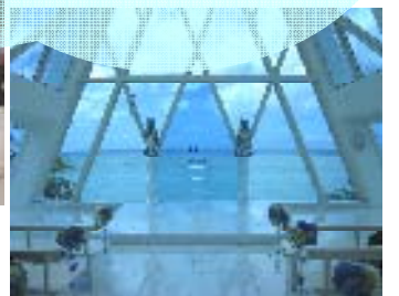
グアムの人気チャペル ブルーアステール

グアム島にあるチャペル・ ブルーアステールへ行って きました。当店にてお申込 のお客様で、当日私も同席 させていただきました！ 青い海・白い砂浜をバック に素敵な挙式ができました