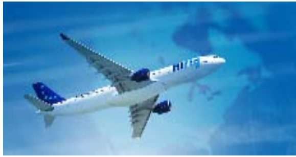
(チャーター便については政府認可申請中です。)

大人気の夏の スイスへ直行便。 エーデルワイス航空 7/6,8/10,8/24 出発8日間！